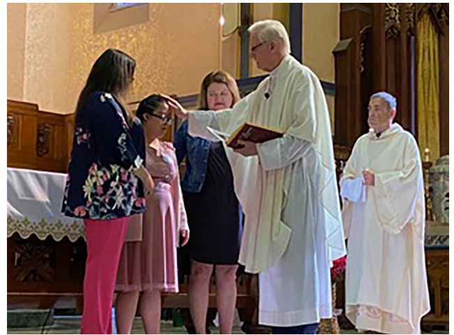
Monseñor Kaczorowski Confirma un Amigo de SPRED.

Durante la mayor parte de un año académico completo, pasé los domingos por la noche ayudando a guiar a un grupo de estudiantes de segundo y tercer año a través de un desafío vespertino de tres horas que incluía misa, una cena en la cafetería y como una hora de instrucción en la fe en el salón de clases.