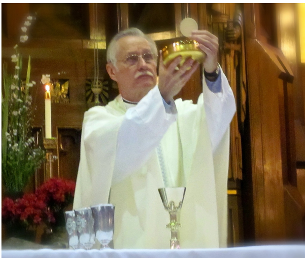
Monseñor Jim Kaczorowski durante la Consagración.

Observaba a un equipo de adultos y niños jóvenes trabajando en un silencio mayormente ininterrumpido –ambientado con música suave de fondo y roto sólo ocasionalmente por conversaciones susurradas- por casi una hora. Me encontré desarmado e hipnotizado por un silencio que me di cuenta de que no era vacío ni vacío, sino rico y lleno de oración. Me sorprendió