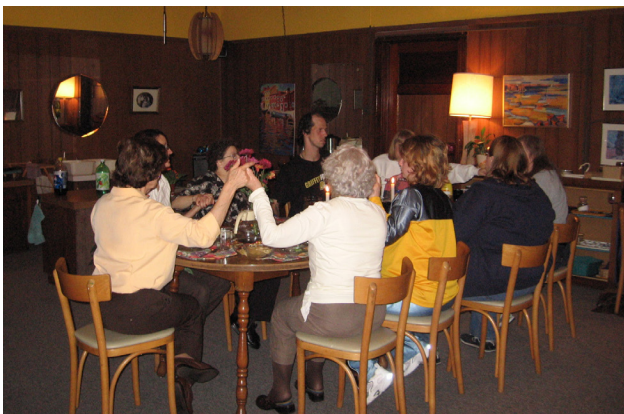
Gracia antes del ágape.

Este método no sólo es seguido por las comunidades de SPRED en la Arquidiócesis de Chicago, sino también por las comunidades de SPRED desarrolladas en diócesis de todo el mundo. La consistencia es importante. Nosotras, como trabajadoras religiosas comunitarias, queremos estar en la misma página para que nuestros amigos puedan cambiar libremente de un grupo de SPRED a otro de acuerdo a su edad. También necesitamos confiar que el Método Vivre esté reflejado en el ministerio de SPRED de todos los grupos.