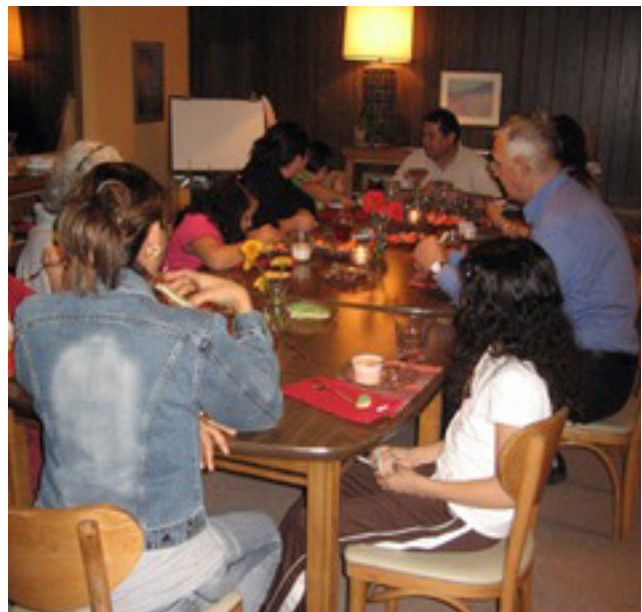
Una mesa hermosa para el ágape.

Durante el verano, compartí una comida con dos ex catequistas de SPRED que fueron parte del