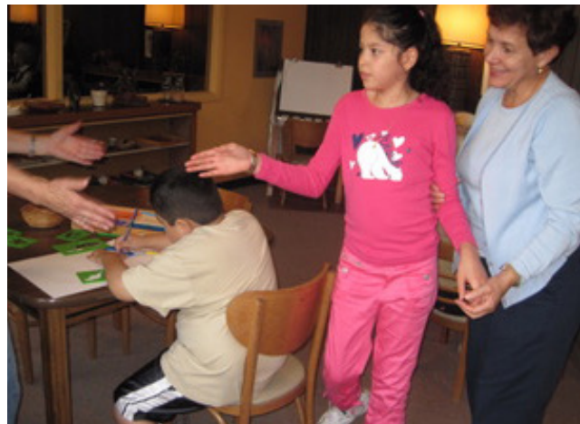
Una bienvenida cálida a una sesión de SPRED.

¿Cómo nos convertimos en una pequeña comunidad de fe en nuestras sesiones de Spred? Primero, necesitamos estar presentes sin nuestros teléfonos celulares y sin relojes. Necesitamos ser fieles a todas las 24 sesiones de un año de Spred. Necesitamos compartir nuestras vidas personales basados en la pregunta propuesta de cada sesión de preparación para catequistas donde el cuarto de celebración se vuelve sagrado para nosotros. Nos reunimos en un semi-círculo alrededor del Libro Sagrado el cual está adornado con flores frescas y una vela. Necesitamos expresar nuestro amor por