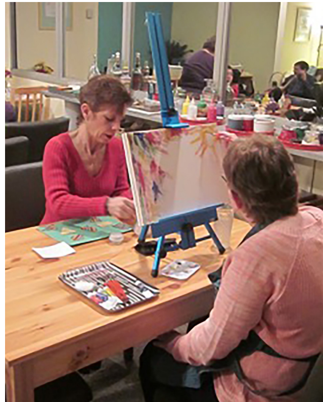
Los compañeros se preparan para una noche de oración.

Que su participación en SPRED los lleve a una vida de oración cada vez más profunda. Que Dios los bendiga.