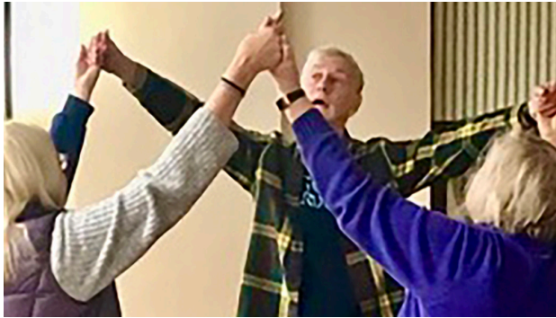
El movimiento de alabanza en respuesta a la Palabra de Dios.