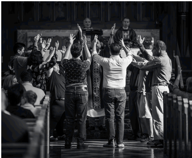
Catequistas y sus amigos le dan vida al salmo con movimiento sagrado.

El movimiento es un poderoso modelador de la vida interior del cuerpo espiritual. Es una expresión de aquello que habita en nuestro interior.