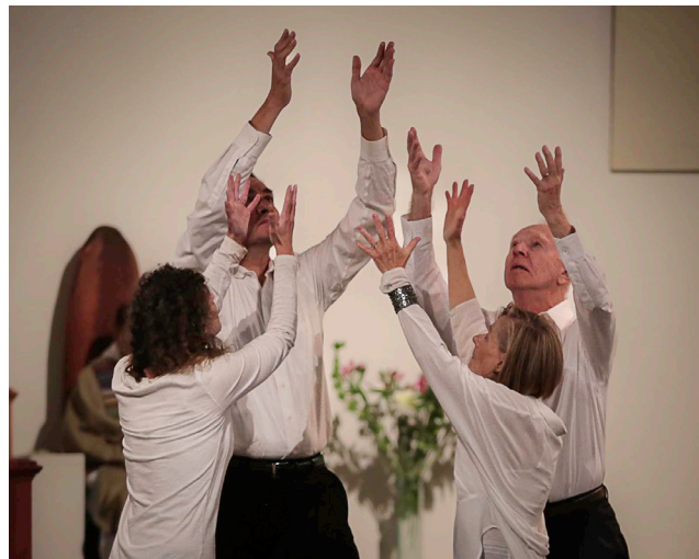
Una oración de escultor conmueve emoción cuando catequistas colaboran para transmitir el misterio.

“Realmente podemos hacer rituales cuando somos elevados al Espíritu, que respira donde quiere. Entonces podremos crear la liturgia como expresión y experiencia del Misterio de Cristo presente en la asamblea”.