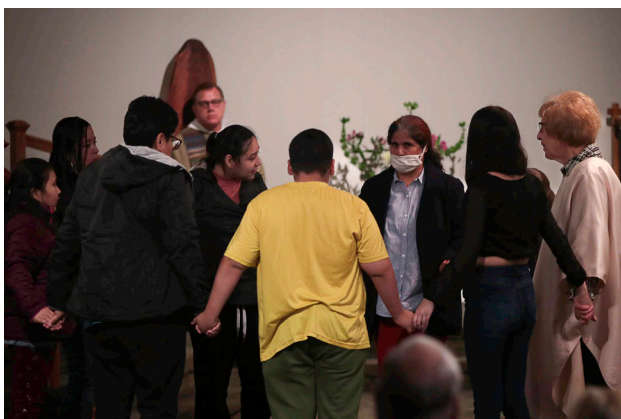
Catequistas y sus amigos en la Capilla de SPRED comparten su ofrenda creativamente.

Vivir y disfrutar la liturgia en la Capilla de SPRED despertó el hambre de llevar esta experiencia sagrada a casa.