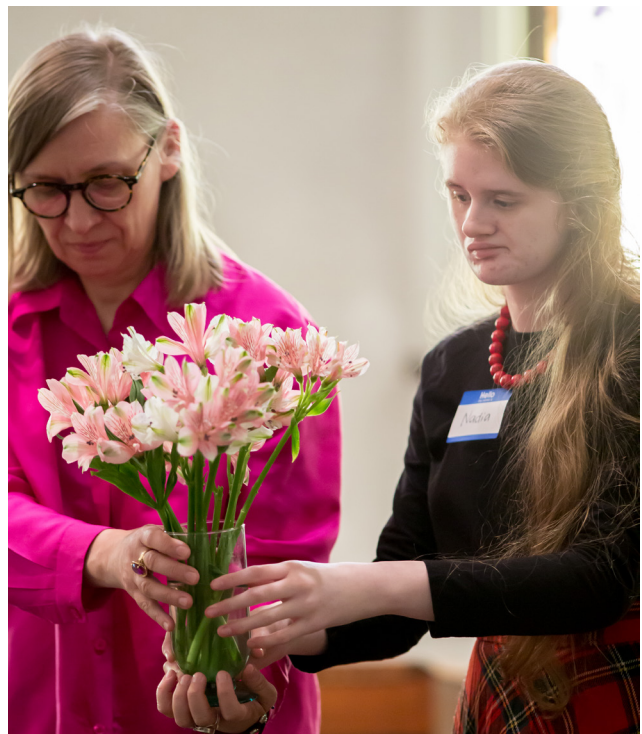
Una participante de SPRED y su madre traen las flores para vestir el altar.

Para preparar el mensaje, el celebrante necesita acceder al hilo dorado dentro de las lecturas del día. Para mí, esta preparación implica participar en la Lectio Divina y escuchar atentamente lo que Cristo intenta comunicarme a mí y a sus amigos amados.