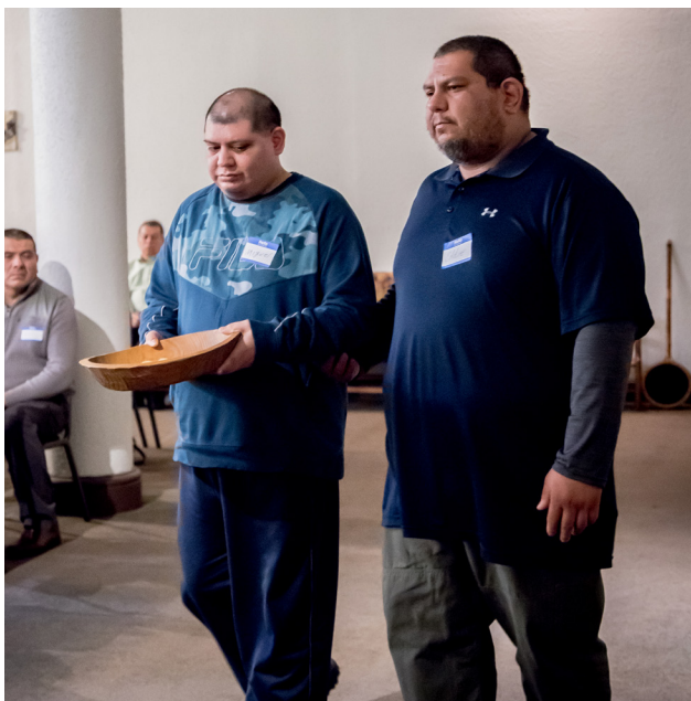
Una participante de SPRED y su hermano participan en la procesión de la entrega del Pan.