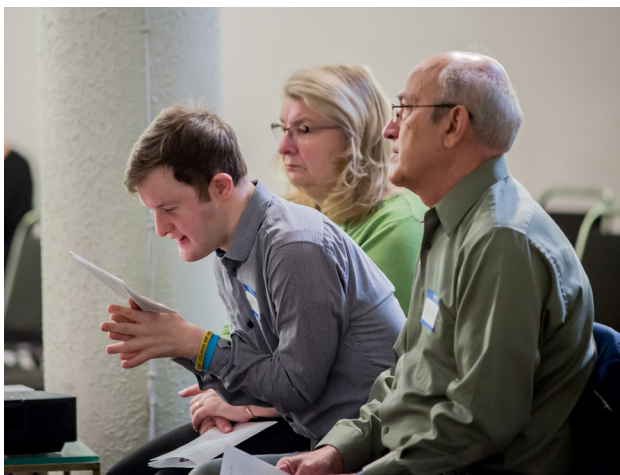
Padres y su hijo se encuentran cómodos y que pertenecen en La Capilla de SPRED.

El mensaje se repite varias veces para permitir que la congregación lo absorba completamente.