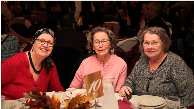
Celebrando con Amigos en la Cena Baile de Mamre.

Los amigos especiales son los recuerdos más queridos en mi caja de memoria. He disfrutado todos los grupos de edades.