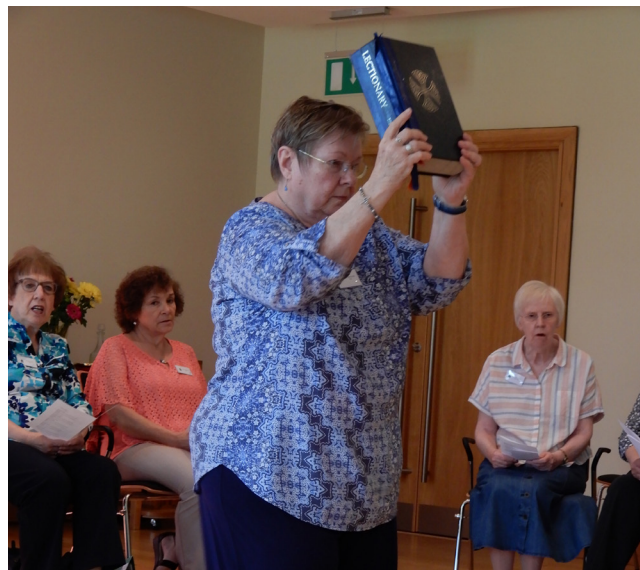
Participando en el Proyecto Apoyo Mutuo en Centro de Retiro Drumalis – Larne, Irlanda.

catequistas es el lugar de bienvenida que nuestros amigos especiales anhelan para abrir los corazones de las catequistas a relaciones significativas con ellos.