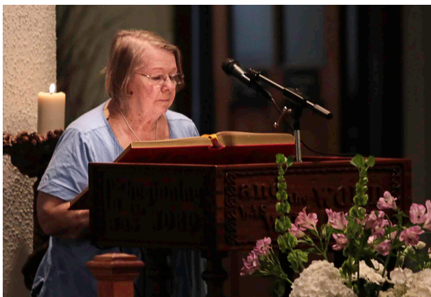
Proclamando la Palabra en una Misa Familiar de SPRED.

El enfoque catequético de SPRED era nuevo para mí. El requisito principal es desear ser un amigo –estar en conexión con los demás para que juntos nos volviéramos testigos del amor inquebrantable de Dios. Como catequistas, somos invitadas a formar una pequeña comunidad de fe en la Sesión de Preparación para Catequistas antes de cada reunión