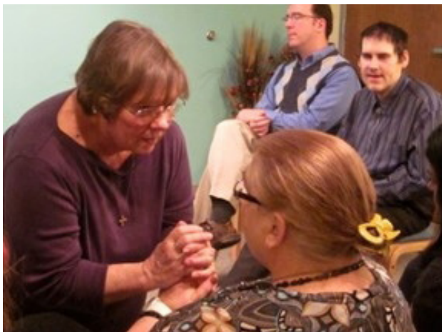
En oración, ofreciendo el Mensaje en una Sesión con la Comunidad Total.

Por muchos años, he sido parte del equipo de entrenamiento que ayuda a los voluntarios a comprender el quién, qué y por qué de la mentalidad de SPRED. Aprender que la fe compartida y la amistad de cada grupo de