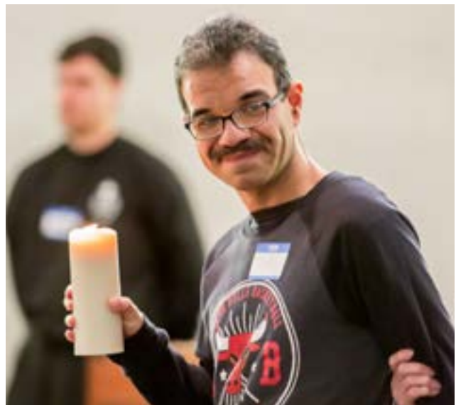
Un amigo de SPRED, acompañado por su catequista, lleva una vela durante la preparación del altar.

En nuestra parroquia, celebramos con nuestros amigos de SPRED. Por ejemplo, octubre está dedicado a Nuestra Señora del Santo Rosario para conmemorar la aparición pública final de la Madre Bendita a los niños pastores de Fátima el 13 de octubre de 1918.