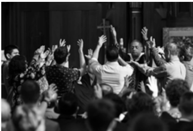
Las catequistas y amigos de SPRED guían a la congregación en el Salmo Responsorial durante la liturgia parroquial de SPRED.

Este mensaje resuena con el espíritu de bienvenida que experimentamos cada vez que participamos en