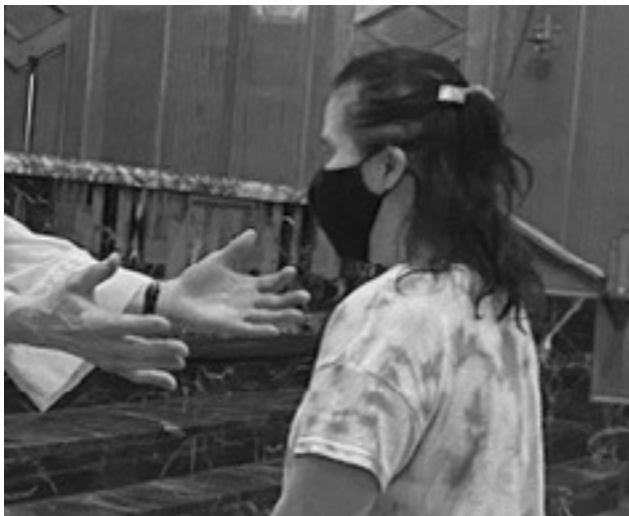
Un amigo de SPRED es recibido calurosamente a la Liturgia parroquial de SPRED por el celebrante.

Los amigos llegaron a la celebración de la JMJ no como observadores sino como peregrinos. Fueron capaces de participar activamente porque la gente de sus comunidades de fe reconoció su presencia y los empoderaron.