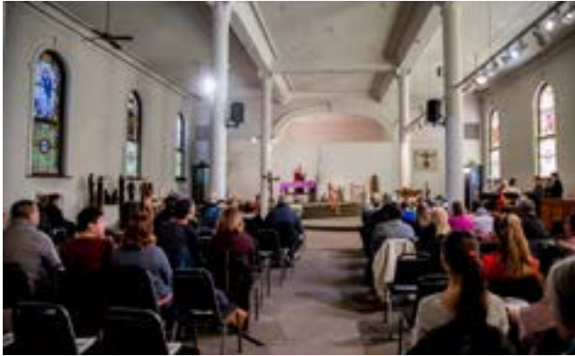
La comunidad de SPRED se reúne con alegría y amor en la Capilla de SPRED para celebrar la liturgia.

misión no sólo dentro de nuestro ambiente de SPRED; debemos mantener en mente nuestra misión sin importar dónde estamos. Seamos conscientes de nuestros amigos dondequiera que estén: en el centro comercial, el teatro, un evento deportivo, la iglesia, el parque y otros lugares donde compartimos espacio con alegría con ellos.